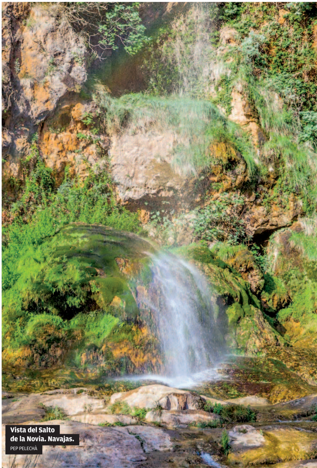
Vista del Salto de la Novia. Navajas.

«La estructura geológica no sólo determina un paisaje de agua, sino que está en la base de un paisaje de montaña, configurando un conjunto de cumbres de gran altura y agudas crestas», describe la profesora Camarasa-Belmonte. El botánico valenciano Antonio José Cavanilles también describía, en